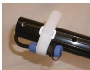
Pozor! Pásku na suchý zip neuvolňujte předčasně!

Při montáži kartáčové hlavy věnujte důkladnou pozornost spirálovému kabelu připojenému do konce tyče pomocí Velcro spojky. Při povolování spojky buďte velmi opatrní nepouštějte kabel a ihned přimontujte ke spojce na kartáči.